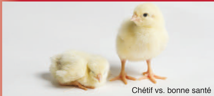
Chétif vs. bonne santé

Pendant deux à trois jours après l'éclosion, les poussins peuvent répondre à tous leurs besoins nutritionnels en absorbant les nutriments contenus dans leur jaune d'oeuf. Pour grandir, se développer et rivaliser avec succès, les poussins doivent consommer rapidement l'eau et les aliments offerts dans le poulailler au cours de cette même période. S'ils n'y arrivent pas, ils seront faibles et ne se rétabliront probablement pas. Ces poussins devraient donc être euthanasiés.